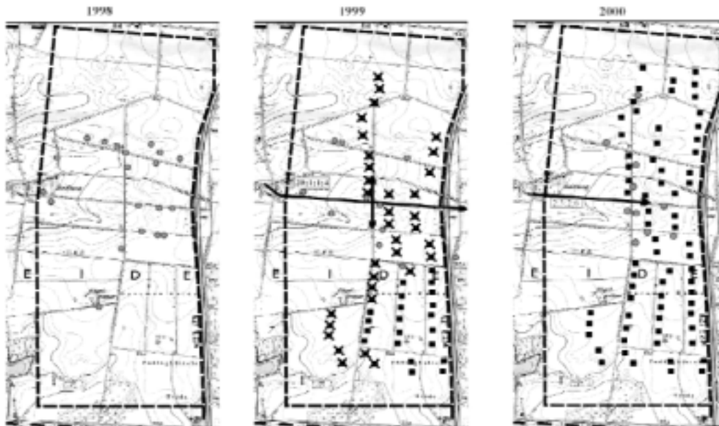
Abb. 2: Verteilung der jagenden Breitflügelfledermäuse ( Eptesicus serotinus ) im Windpark Midlum von 1998-2000 (graue Punkte = jagende Tiere; Pfeile = Flugstraße; schwarze Quadrate = in Betrieb befindliche WEA; durchgekrenzte schwarze Quadrate = nicht in Betrieb befindliche WEA). - Distribution of hunting Serotine Bats ( Eptesicus serotinus ) in the windpark Midlum in the years 1998-2000 (grey circle = hunting animals; arrows = flightpaths; black square = working windturbines; black square with x = not working windturbines).